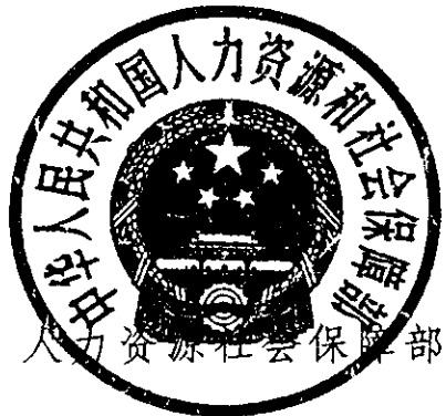
人力资源社会保障部